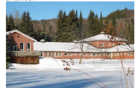
Maison de la Communauté du Chemin Neuf à Rawdon

Depuis sa fondation, la Communauté a pour principale mission de former des chrétiens pour les soutenir dans l'Église et la société. Le service concret et direct de l'église locale est un axe privilégié de l'activité apostolique de la Communauté. Ces dernières années, plusieurs évêques ont confié à la Communauté du Chemin Neuf la responsabilité de paroisses (dont la paroisse Ste-Rose-de-Lima, à Laval au Québec).